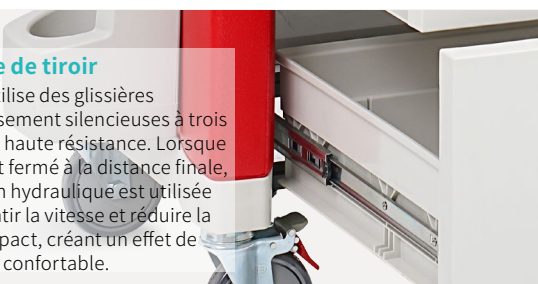
Table de travail

Le tiroir utilise des glissières d'amortissement silencieuses à trois sections à haute résistance. Lorsque le tiroir est fermé à la distance finale, la pression hydraulique est utilisée pour ralentir la vitesse et réduire la force d'impact, créant un effet de fermeture confortable.